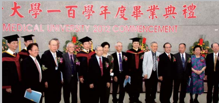
101年6月9日舉行100學年度畢業典禮嘉賓雲集會後合影